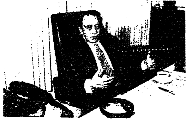
اليهود بغاليتهم الساحقة يتقدمون الى التقارب مع العرب